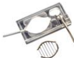
Perfusion and Imaging Chambers