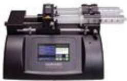
Highest Performance Syringe Pumps

Več informacij na www.syringepumpdirect.com