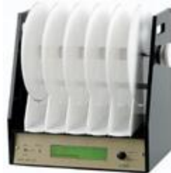
Motor and Sensory Experiment Products