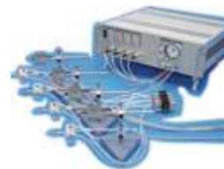
Ventilate 10 Animals Simultaneously!