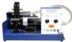
Model 613 Ventilator for Large Animals

V ponudbi so anestezijski in inhalacijski sistemi za živali.