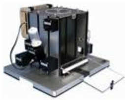
Products for Anxiety & Depression Studies

Oprema za študij fizioloških in drugih biomeritev obsega sisteme za neinvazivno merjenje krvnega tlaka, temperature, NO in druge sisteme, ki vam bodo olajšali nevrološke ali vedenjske eksperimente.