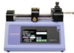
The Scientists First Choice For Syringe Pumps